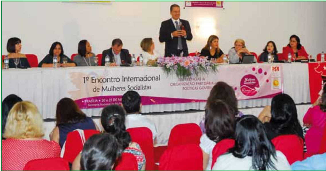
Mesa do 1º Encontro Internacional de Mulheres do PSB tendo ao centro o governador Eduardo Campos, presidente nacional do PSB, transmitindo suas saudações às participantes.

Durante o evento foi lida e aprovada, pelas representantes de todos os partidos sul-americanos presentes, a Carta de Brasília com a criação do Fórum de Mulheres Socialistas Sul-Americanas .