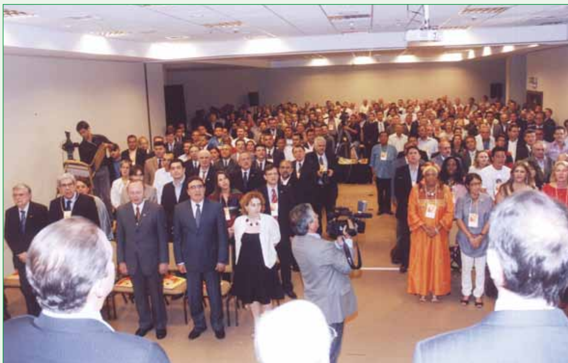
Plenário do “Seminário Desafios dos Governos Socialistas”, realizado no Centro Brasil XXI, em Brasília/DF.