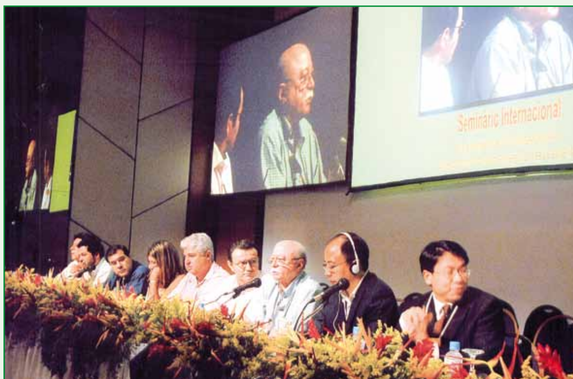
Plenário do “Seminário Internacional sobre Experiências Socialistas Chinesa e de Governos de Esquerda em Países Capitalistas”, no Rio de Janeiro, no Rio Othon Palace.