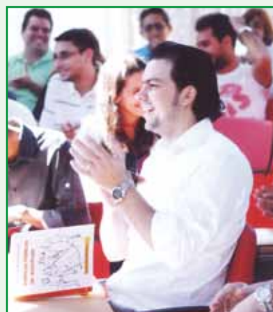
Alunos do "Curso de Políticas Públicas de Juventude", em Brasília-DF.