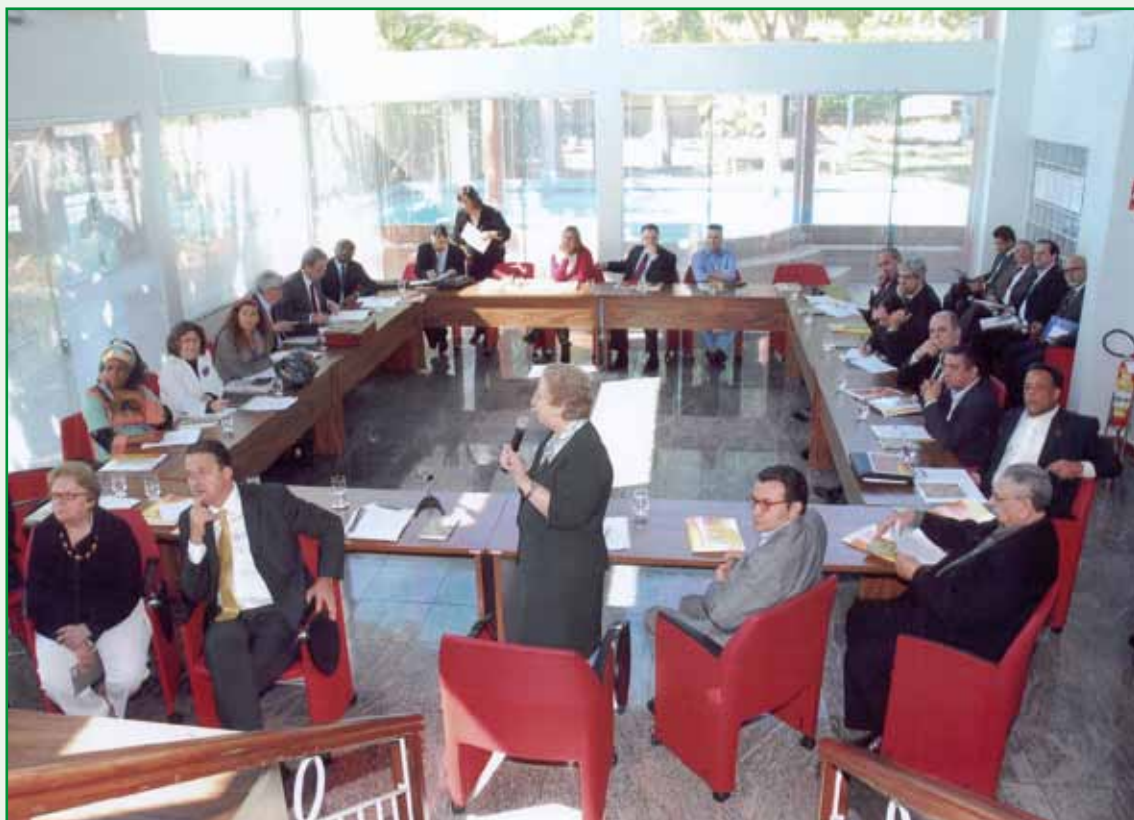
“Seminário de Planejamento Estratégico” com os integrantes da Comissão Executiva Nacional do PSB, na sede da FJM/Brasília-DF.

Para realizar esse processo foi contratada a Consultoria Econômica e Planejamento (Ceplan), que tem como diretora a renomada economista Tânia Bacelar de Araújo e sua equipe de especialistas.