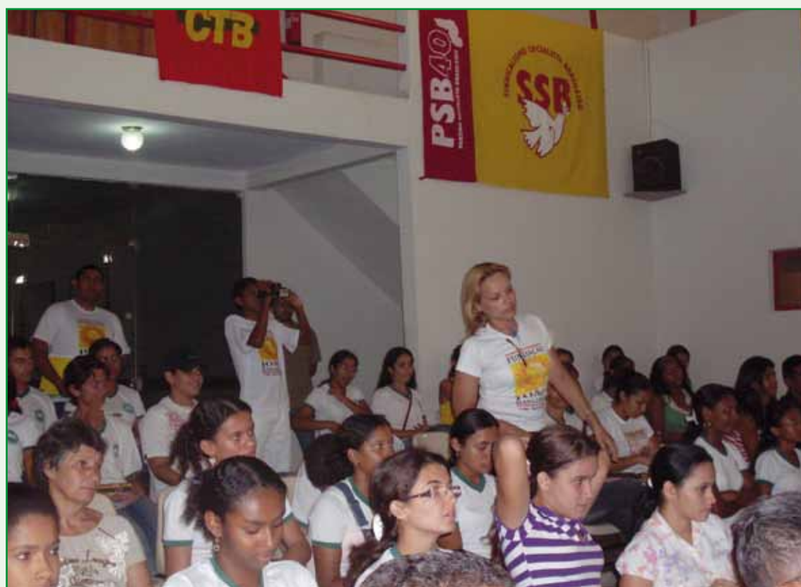
Plenário do “Seminário de Formação Política” promovido pelo Núcleo da FJM/PI.