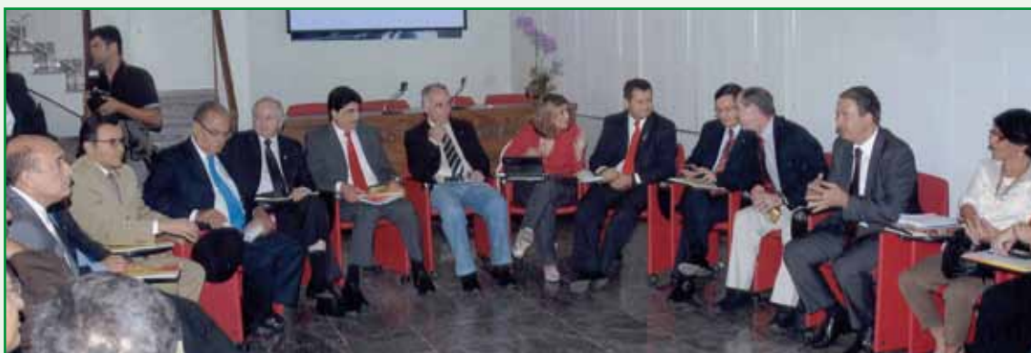
“Seminário de Planejamento Estratégico” para os integrantes das bancadas do PSB no Senado Federal e na Câmara dos Deputados, na sede da FJM.