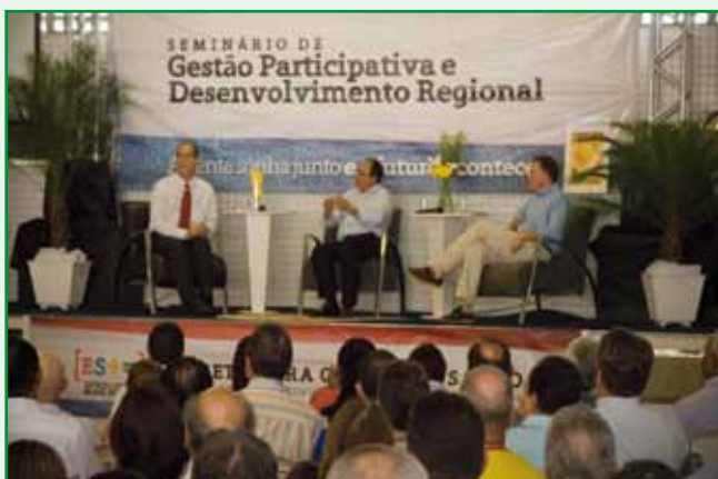
Deputado Ciro Gomes e o governador Renato Casagrande , em debate com a plenária.

Em cada atividade foram realizadas palestras com foco no desenvolvimento regional e apresentadas experiências de gestões bem sucedidas. Também foram realizadas oficinas temáticas, com a participação dos diferentes agentes sociais, como lideranças, partidos políticos, segmentos empresariais, movimentos sociais.