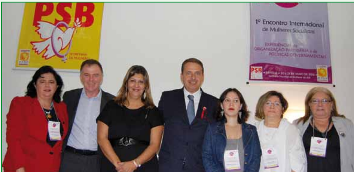
Governadores Eduardo Campos e Renato Casagrande, presidente nacional do PSB, ladeado por lideranças do Movimento Socialista de Mulheres.