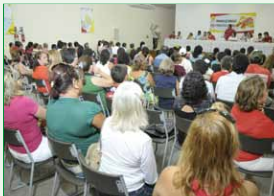
Mesa e plenário do “Seminário Transformar Ideias em Projetos Inovadores”, promovido pelo Núcleo da FJM/RN.

Os seminários foram realizados em Natal (22 de agosto); Santana do Matos (29 de agosto); João Câmara (30 de agosto); São Paulo do Potengi (12 de setembro); Santa Cruz (13 de setembro); Parnamirim (19 de setembro); Canguaretama (17 de outubro); Pau dos Ferros (22 de novembro); Carnaubais (29 de novembro); Mossoró (12 de dezembro); Caraúbas (12 de dezembro); Caicó (19 de dezembro).