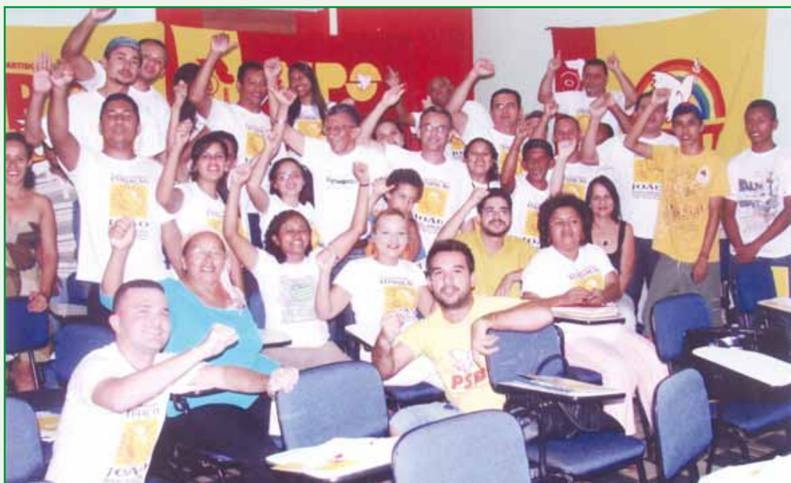
Plenário do “Seminário de Formação Política” promovido pelo Núcleo da FJM/PI.