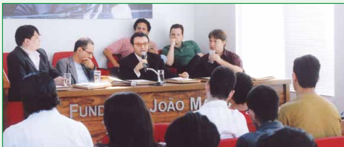
Mesa de Abertura do Curso de Políticas Públicas de Juventude, na sede da FJM/Brasília-DF.