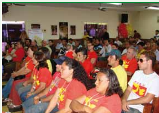
Plenário do “Seminário de Formação Política” promovido pelo Núcleo da FJM/RN.

O núcleo da FJM/RN realizou, em parceria com o PSB estadual, 12 seminários regionais com o tema Transformar ideias em projetos inovadores , discutindo a filosofia do PSB, fazendo análise da conjuntura política nacional e local, do desenvolvimento regional e da gestão política. Os eventos atingiram cerca de quatro mil pessoas. Nessas ocasiões foi realizado um levantamento para conhecer as expectativas das populações locais para auxiliar na elaboração de um programa de governo estadual.