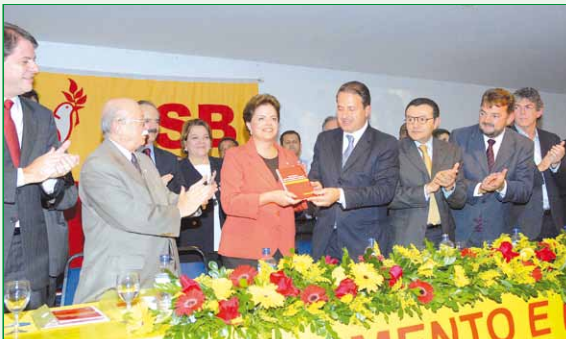
Governador Eduardo Campos, presidente nacional do PSB, entrega as propostas de políticas públicas do PSB para a então candidata à Presidência da República Dilma Rousseff.

No dia 19 de julho de 2010, foi realizado em Brasília o seminário Brasil, Desenvolvimento e Inclusão Social , com a presença de cerca de 650 pessoas, toda a Direção Nacional do PSB e os candidatos a governador, ao Senado e à Câmara dos Deputados do PSB em todo o Brasil.