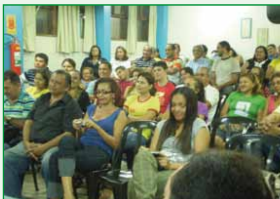
Plenário do “Seminário de Formação Política”, realizado em Manaus/AM.