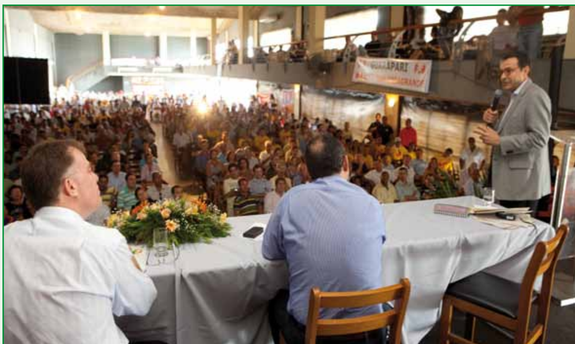
Governador Renato Casagrande , Ciciliote (presidente do PSB/ES) e Carlos Siqueira (ao microfone) por ocasião do seminário, em Vitória/ES, "Projeto para o Espírito Santo – Gestão Participativa – Desenvolvimento Regional".

Em cada atividade foram realizadas palestras com foco no desenvolvimento regional e apresentadas experiências de gestões bem sucedidas. Também foram realizadas oficinas temáticas, com a participação dos diferentes agentes sociais, como lideranças, partidos políticos, segmentos empresariais, movimentos sociais.