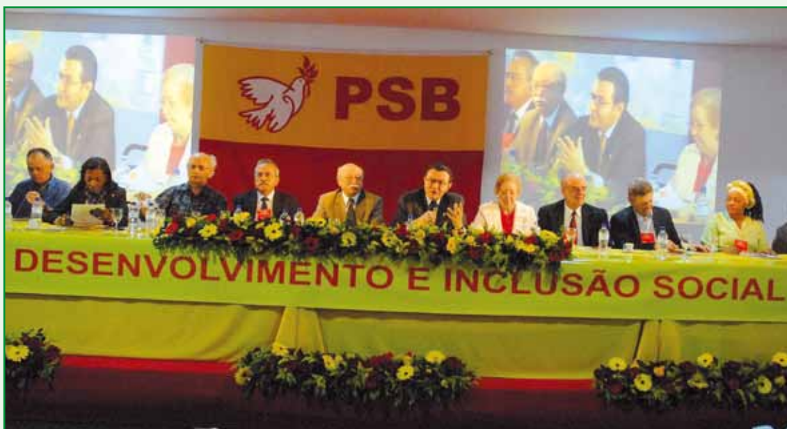
Mesa do "Seminário Brasil – Desenvolvimento com Inclusão Social".