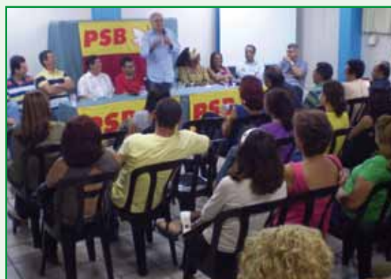
“Seminário de Formação Política”, durante intervenção do ex-prefeito de Manaus e presidente do PSB/AM, Serafim Corrêa.