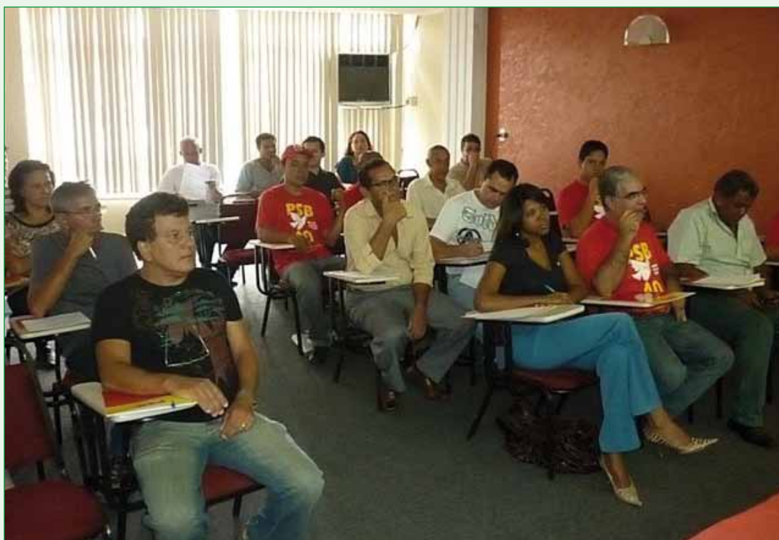
“Curso de Multiplicadores de Formação Política”, FJM/MG.